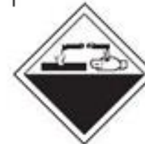
Danger class 8 Corrosive materials