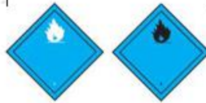
Danger class 4.3