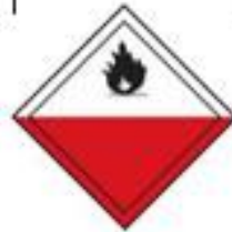
Danger class 4.2