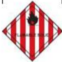
Danger class 4.1