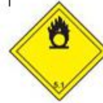
Danger class 5.1 Oxidizer