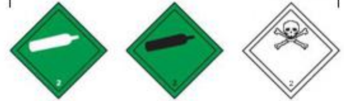
Danger class 2 - Gases