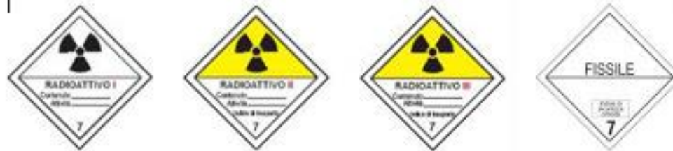
Danger class 7 - Radioactive components