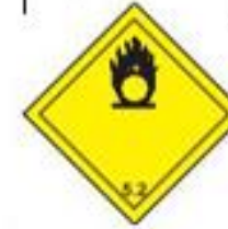
Danger class 5.2 Organic peroxide