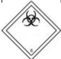
Danger class 6.2 Infectious substances