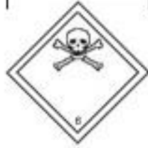
Danger class 6.1 Toxic substances