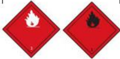
Danger class 3 Flammable liquids